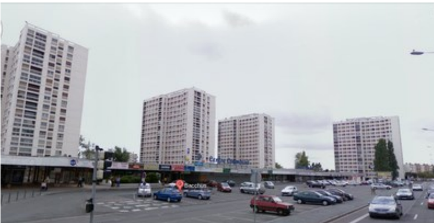
Vue de devant, centre commercial, place de Provence

L'espace central est le lieu du plus grand marché forain du département. Tous les dimanches, nombreux sont ceux qui viennent aux Couronneries pour cet événement. Toutefois, le centre commercial, qui borde la place « du marché », a perdu son attractivité d'origine, au fur et à mesure que le quartier changeait d'image. On observe ainsi une dégradation progressive de l'occupation des cellules commerciales en quantité et surtout en qualité.